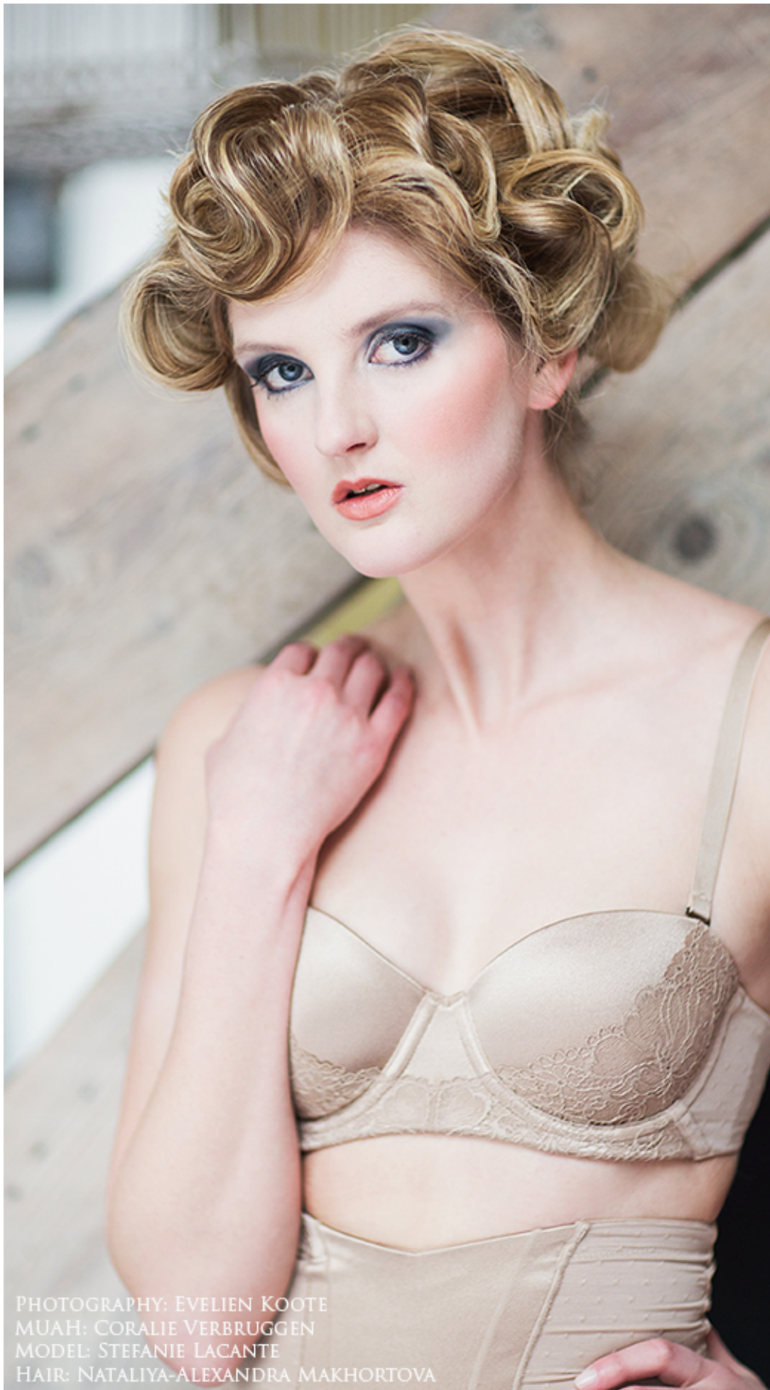
MUAH: CORALIE VERBRUGGEN MODEL: STEFANIE LACANTE HAIR: NATALIYA-ALEXANDRA MAKHORTOVA